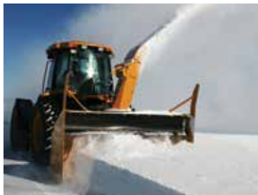
INDUSTRIELLES À GRANDE VIS (PGV)