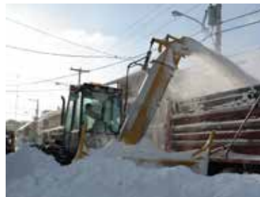
INDUSTRIELLES À VIS PLEINES