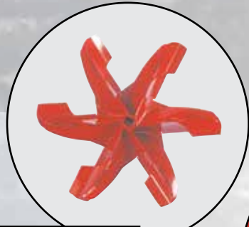
ROTOR À 4, 5 OU 6 PALES