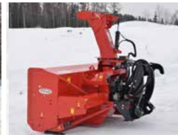
HYDRAULIQUE HAUTE EFFICACITÉ